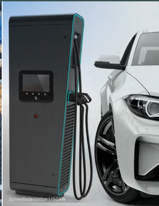
Schnellladestation | 150 kW