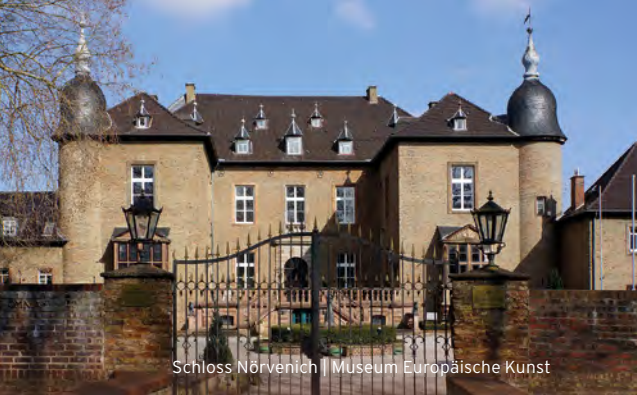
Schloss Nörvenich | Museum Europäische Kunst