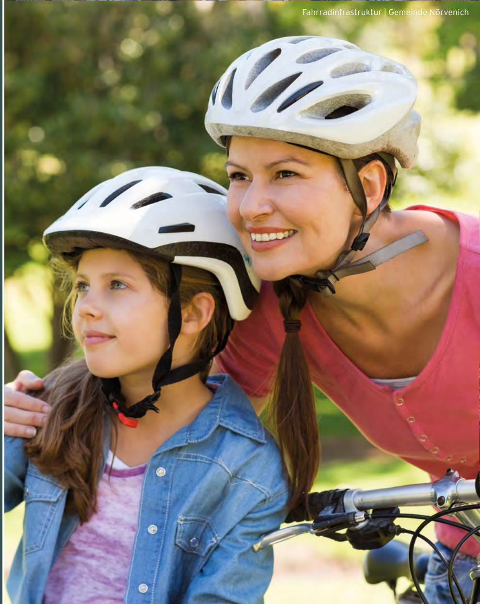
Fahrradinfrastruktur | Gemeinde Nörvenich