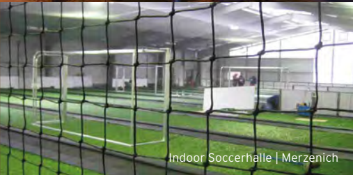
Indoor Soccerhalle | Merzenich