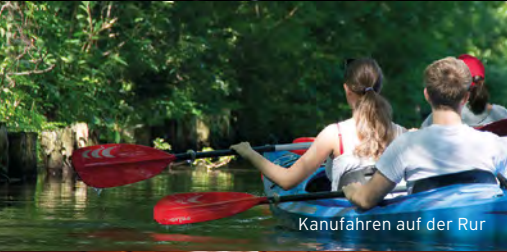
Kanufahren auf der Rur