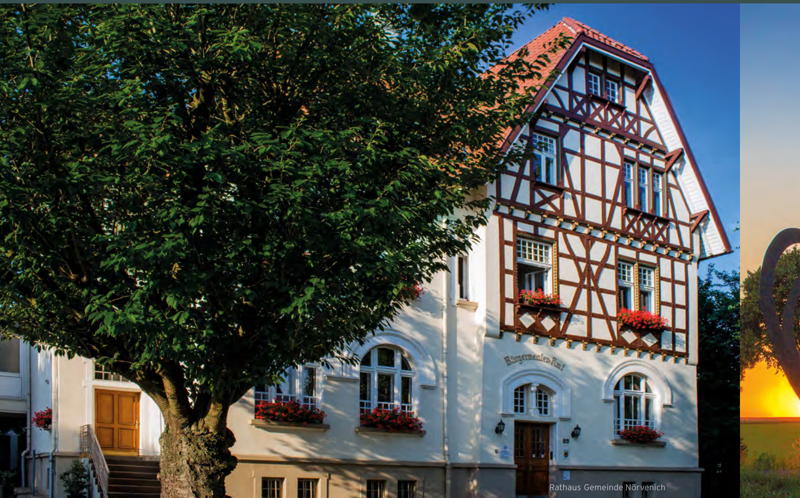
Rathaus Gemeinde Nörvenich

Gemeinsam für eine noch bessere Zukunft und eine noch lebenswertere Gemeinde