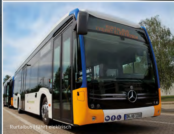
Rurtalbus | fährt elektrisch