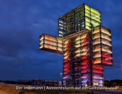
Der Indemann | Aussichtsturm auf der Goldsteinkuppe