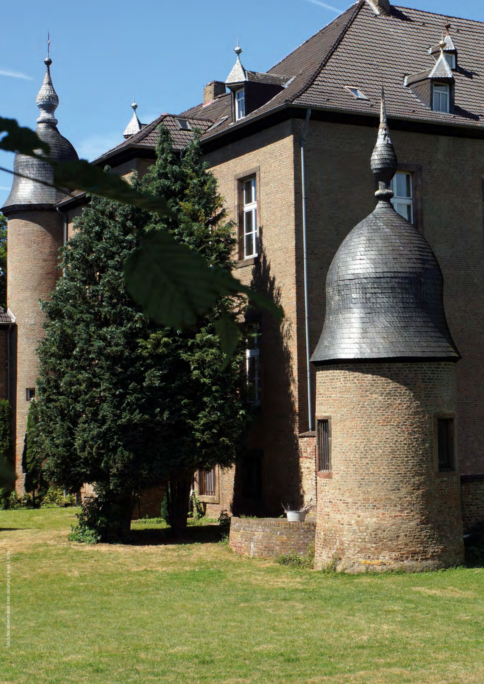
Foto: Schloss Mönchenhof, Mönche Stock / Gestaltung, A+design, E. Aschke