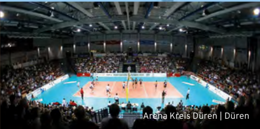
Arena Kreis Düren | Düren